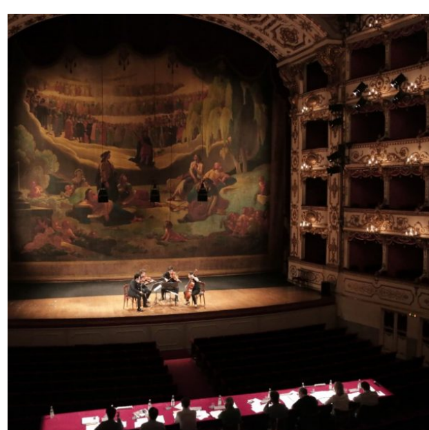
Ancora uno stop: posticipato al 2021 il Concorso per Quartetto d'archi "Premio Paolo Borciani"